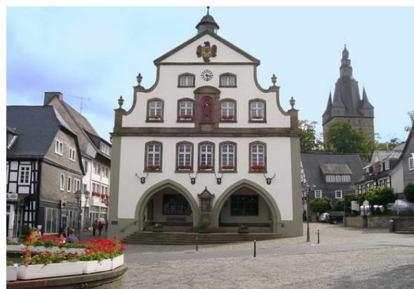
Rathaus in Brilon