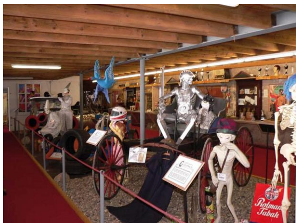
Curioseum in Willingen